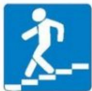
Знак 6.6. Подземный пешеходный переход

Самые безопасные переходы — подземный и надземный. Они обозначаются вот такими знаками.