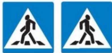
Знаки 5.19.1 и 5.19.2 Пешеходный переход

Если нет подземного или надземного пешеходного перехода, можно перейти по наземному пешеходному переходу