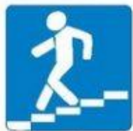
Знак 6.6. Подземный пешеходный переход