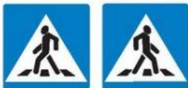
Знаки 5.19.1 и 5.19.2 Пешеходный переход

Если нет подземного или надземного пешеходного перехода, можно перейти по наземному пешеходному переходу