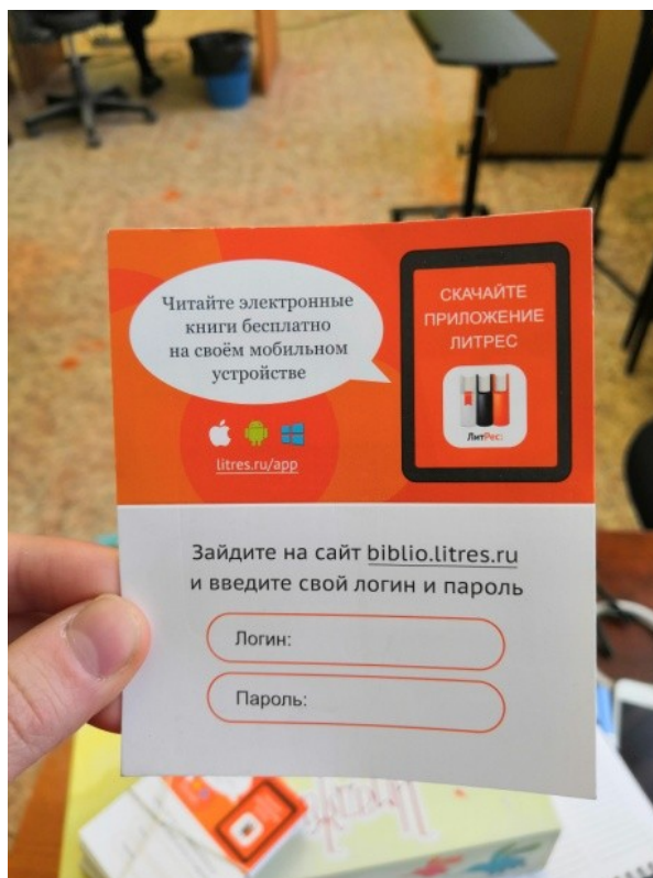
Рис. 2. Типовой читательский билет

5. Чтобы ваши логин и пароль всегда были у вас под рукой, вы можете получить типовой читательский билет в библиотеке, в которой подавали заявку на регистрацию (рис. 2),