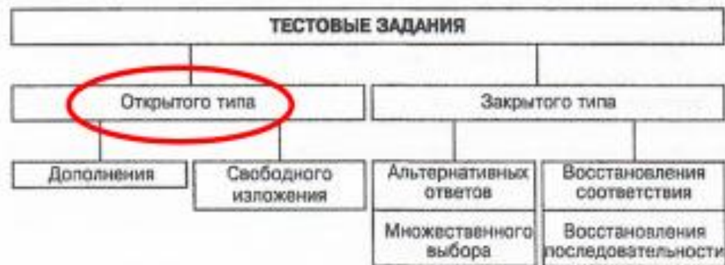
Рис. 2.1. Классификация тестовых заданий (А.Н. Майоров)