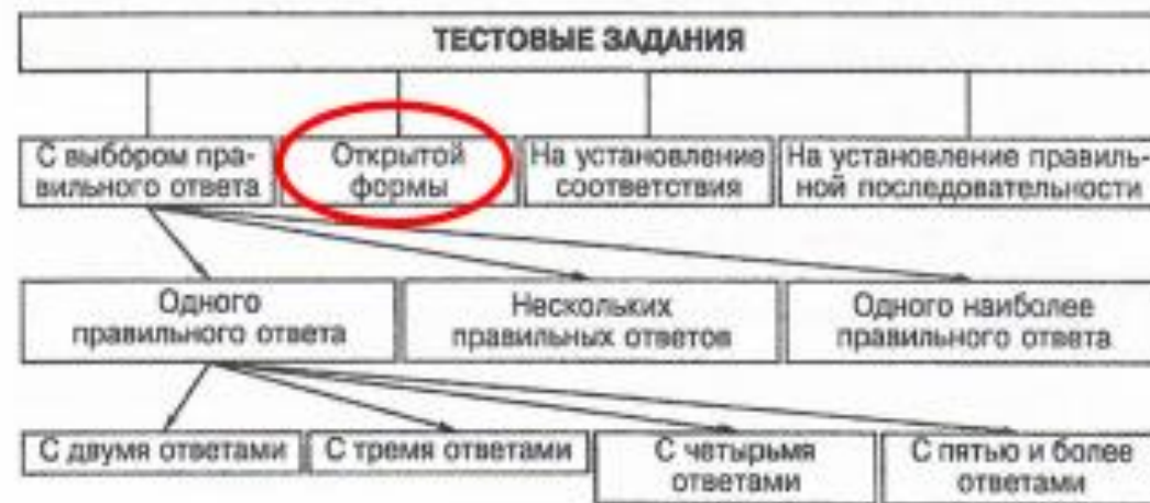
Рис. 2.2. Классификация тестовых заданий (В.С. Аванесов)