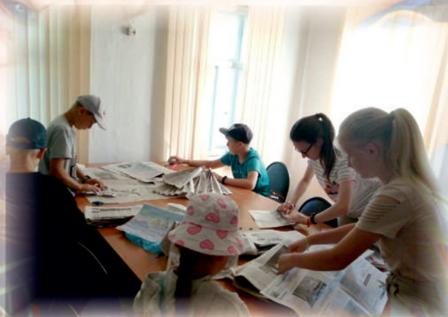
Подготовка к Игре

В назначенный час команды собрались в тени берез. Игра началась с путешествия во времени.